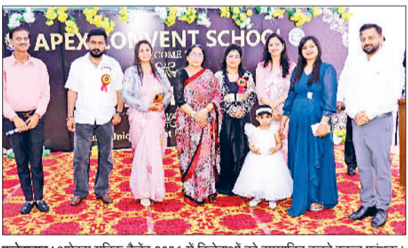
फतेहाबाद। अपेक्स यूनिवर्सिटी टैलेंट 2026 में विजेताओं को सम्मानित करते स्कूल प्रबंधक।

बढ़-चढ़कर भाग लिया। रैम्य वॉक में 2 से 4 वर्ष तक के नन्हे बच्चों ने अपने आत्मविश्वास और मासूमियत से रैम्य पर जलवे बिखेरे। फैसी ड्रेस में आकर्षक वेशभूषा में सजे 4 से 6 वर्ष तक के बच्चों ने अपनी प्रस्तुति से सबका मन मोह लिया। नृत्य प्रतियोगिता में 6 से 8 वर्ष तक के प्रतिभावान बच्चों ने अपने थिरकते कदमों से दर्शकों को मंत्रमुग्ध कर दिया। प्रतिभागियों का मूल्यांकन आत्मविश्वास, सृजनात्मकता, वेशभूषा और मंच कौशल जैसे कई मानकों के आधार पर किया गया।