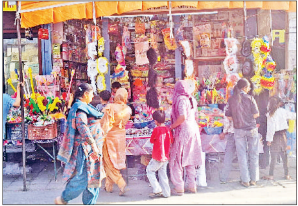
फतेहाबाद। जवाहर चौक में होली पर सजी दुकान।