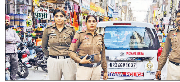
सिरसा। बाजारों में गश्त करती पुलिस टीम।

है। उन्होंने कहा कि कि यहां धन-दौलत के लाभ की बात नहीं हो रही, अपितु यह जानने योग्य है कि हमारे भीतर विकारों की कितनी गांठें कम हुई हैं? वे पहले से बंदी हैं या घटी हैं, इसका हिसाब लगाना ही सच्ची चतुर्मासी है। होली के पर्व का मधुर संदेश देते हुए गुरुदेव ने कहा कि ‘होली सो होली’, अर्थात् जो भूतकाल में हो गया उसे भुलाकर आज नई शुरुआत करें। पिछली बातों पर कंटा लगाकर मन को हल्का कर लेना चाहिए। उन्होंने आह्वान किया कि जिनसे भी आपकी अनबन या मनमुटाव है, उनसे आज हृदय से क्षमायाचना कर लें और निडर होकर ‘आई एम वैरी सॉरी’ कहें। गुरुदेव ने होली मनाने के तरीके पर मार्गदर्शन देते हुए दो मुख्य बातों पर जोर दिया। उन्होंने कहा कि जल है तो कल है। पानी को व्यर्थ न गंवाएं और सूखे रंगों (गुलाल) के साथ तिलक लगाकर उत्सव मनाएं। मादक पदार्थों का सेवन स्वास्थ्य के लिए घातक है। पर्व मनाते समय अपनी सेहत का ख्याल रखें और नशे से पूरी तरह दूर रहकर ‘शुद्ध होली’ मनाएं। प्रवचन के अंत में गुरुदेव ने सभी को प्रेम और भाईचारे के साथ सादगीपूर्ण तरीके से त्योहार मनाने का आशीर्वाद दिया।