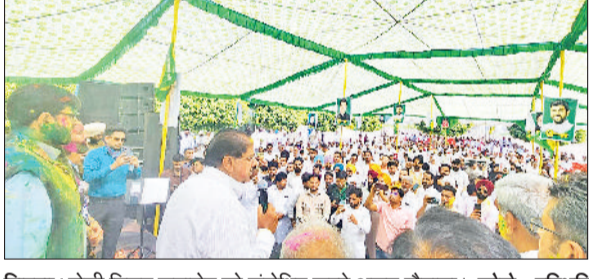
सिरसा। होली मिलन समारोह को संबोधित करते अजय चौटाला।