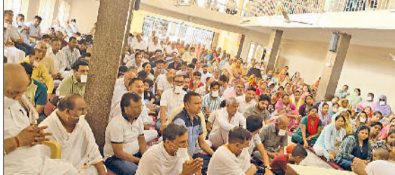
फतेहाबाद। एसएस जैन सभा में आयोजित कार्यक्रम में उपस्थित श्रद्धालुगण।